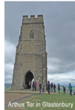
Arthurs Tor in Glastonbury

ABBOTSBURY SWANNERY - Besuch bei den Schwänen der Queen, STONEHENGE & AVEBURY & HÜGELGRAB von AVEBURY, GLASTONBURY TOR & Eichen GOGG und MAGOGG , Heilige Quellen CHALICE WELL & WHITE SPRING, GLASTONBURY ABBEY & ST. MARGARET'S CHAPEL & GLASTONBURY HIGHSTREET , mit den vielen extravaganten Shops, KATHEDRALE & BISHOPSPALACE von WELLS sowie weitere kleinere Highlights, warten auf uns.