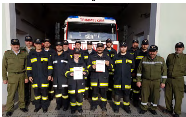
12 Feuerwehrkameraden erwarben die Leistungsabzeichen.

Nachdem die Abnahme erfolgreich absolviert wurde, durften 11 Feuerwehrkameraden das Leistungsabzeichen in Silber und 1 Feuerwehrkamerad das Leistungsabzeichen in Bronze von HAW Schreierer entgegennehmen. Die Prüfung bildet eine wichtige Basis für die gesamte Mannschaft, um auch im Einsatz die erforderliche Routine mitzubringen.