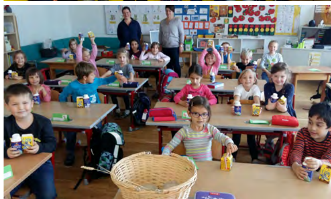
Besuch der Bäuerinnen in der Volksschule St. Pantaleon.