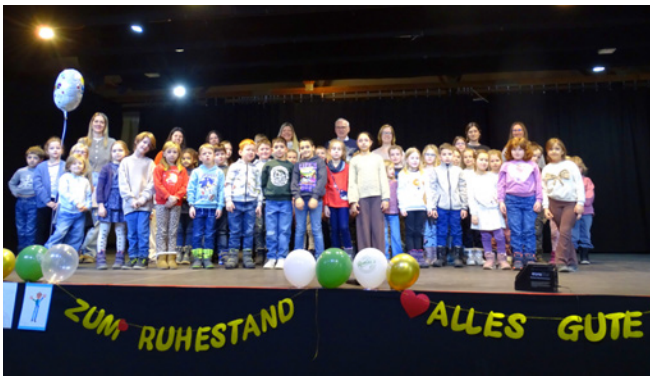
Volksschule St. Pantaleon - als Vertreter aller Schulen.