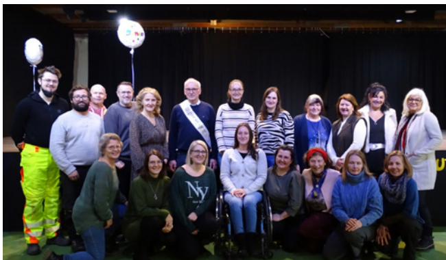
Voit mit den Angestellten der Gemeinde.