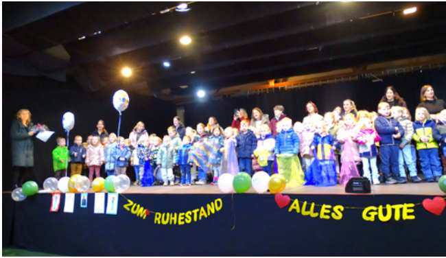
Kindergarten und Krabbelstube.