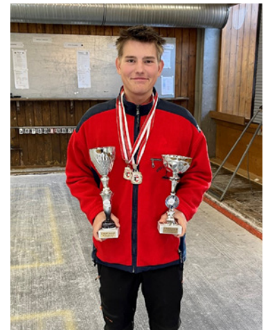
Foto: Jonas Humer bei den Jugend Ziel-Landesmeisterschaften in Wals

Mit Zuversicht, Motivation und starkem Teamgeist blickt der Verein optimistisch in die nächste Saison.