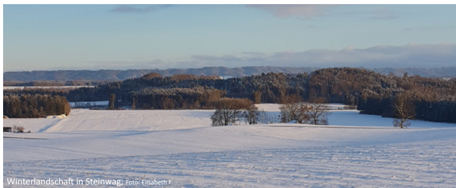
Winterlandschaft in Steinwag; Foto: Elisabeth F.